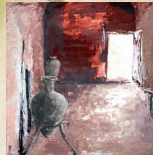
Luz en los baños Técnica mixta sobre táboa 40 x 40 cm