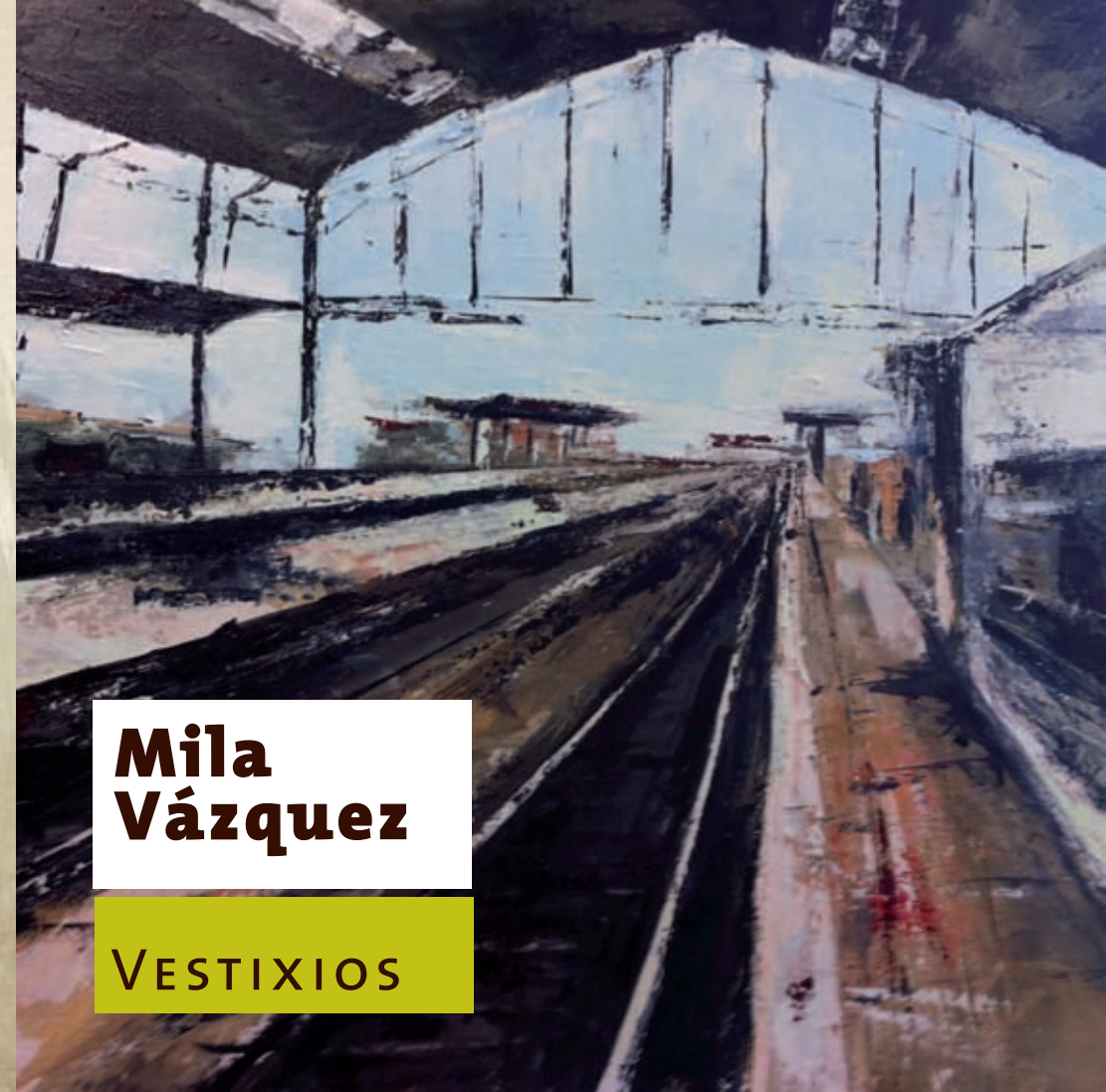
SCQ estación Técnica mixta sobre lenzo 54 x 65 cm (Portada)