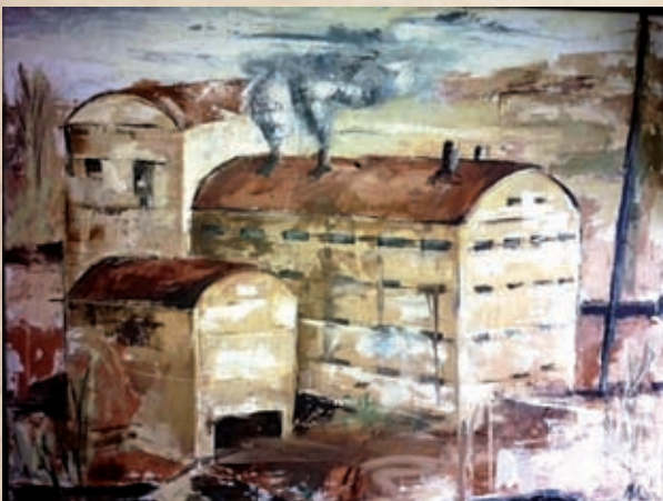
Panello Técnica mixta sobre lenzo 73 x 93 cm