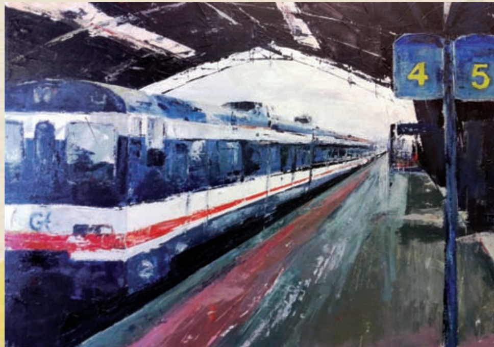
Vía 4 Técnica mixta sobre lenzo 46 x 65 cm