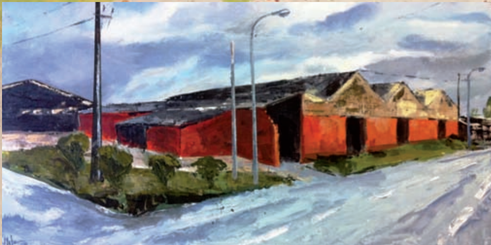
Maderera Técnica mixta sobre táboa 30 x 60 cm