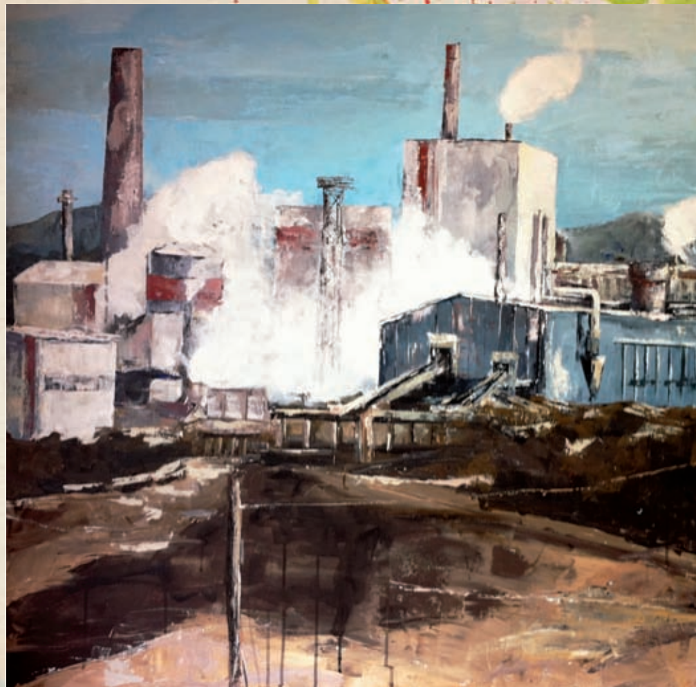
Ence Técnica mixta sobre lenzo 25 x 33 cm

Nestes momentos é gratificante para os axentes culturais poder ver como os proxec-